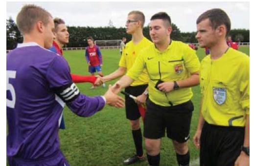
Un trio à pied d'œuvre