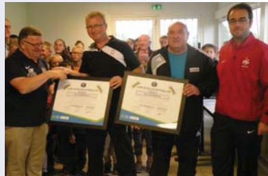
Le label de bronze pour l'ES Puy Vaudelnay