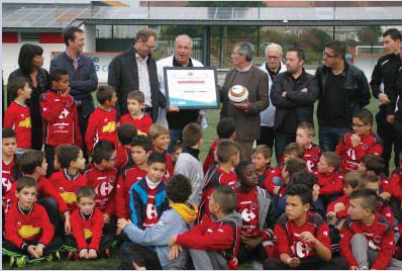
Le label d'argent pour le SO Cholet

Des efforts et du travail ...voilà la recette pour obtenir un label. Durant le mois d'octobre de nombreux clubs ont reçu cette récompense tels que Trémentines, Val de Moine, St Hilaire Vihiers, St Aubin JS Layon, Andrezé Jub Jallais et Beau-preau. Ces remises de label se poursuivront durant les prochaines semaines.