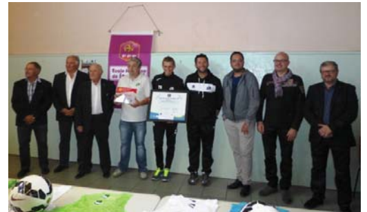
Le label féminin et le label de bronze pour la Croix Blanche Angers