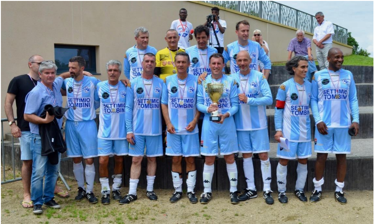
Angers Ndc Équipe vainqueur de la Coupe Paul Augelle – Juin 2018