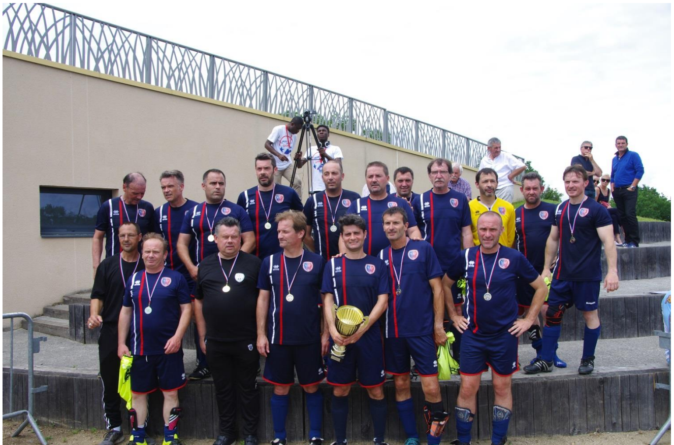
Ecouflant As Équipe finaliste de la Coupe Paul Augelle – Juin 2018