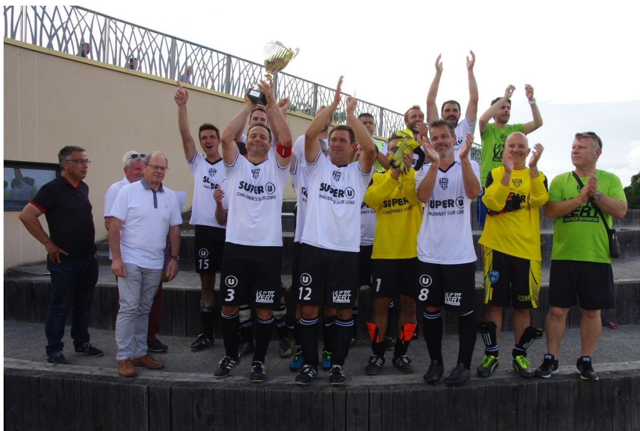
Chalonnnes Chaudef Équipe finaliste de la Coupe de l'Anjou Vétérans – Juin 2018