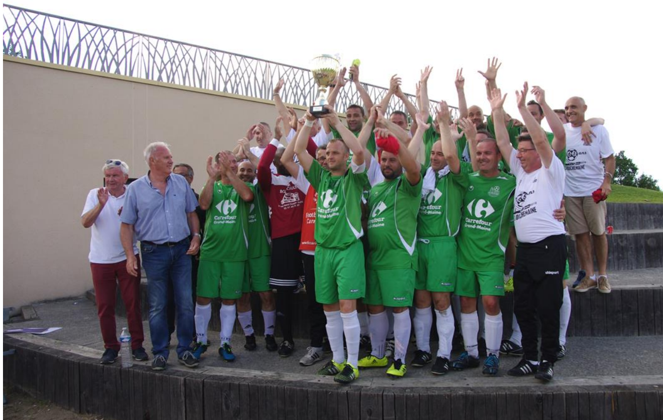
Bouchemaine Es Équipe vainqueur de la Coupe de l'Anjou Vétérans – Juin 2018