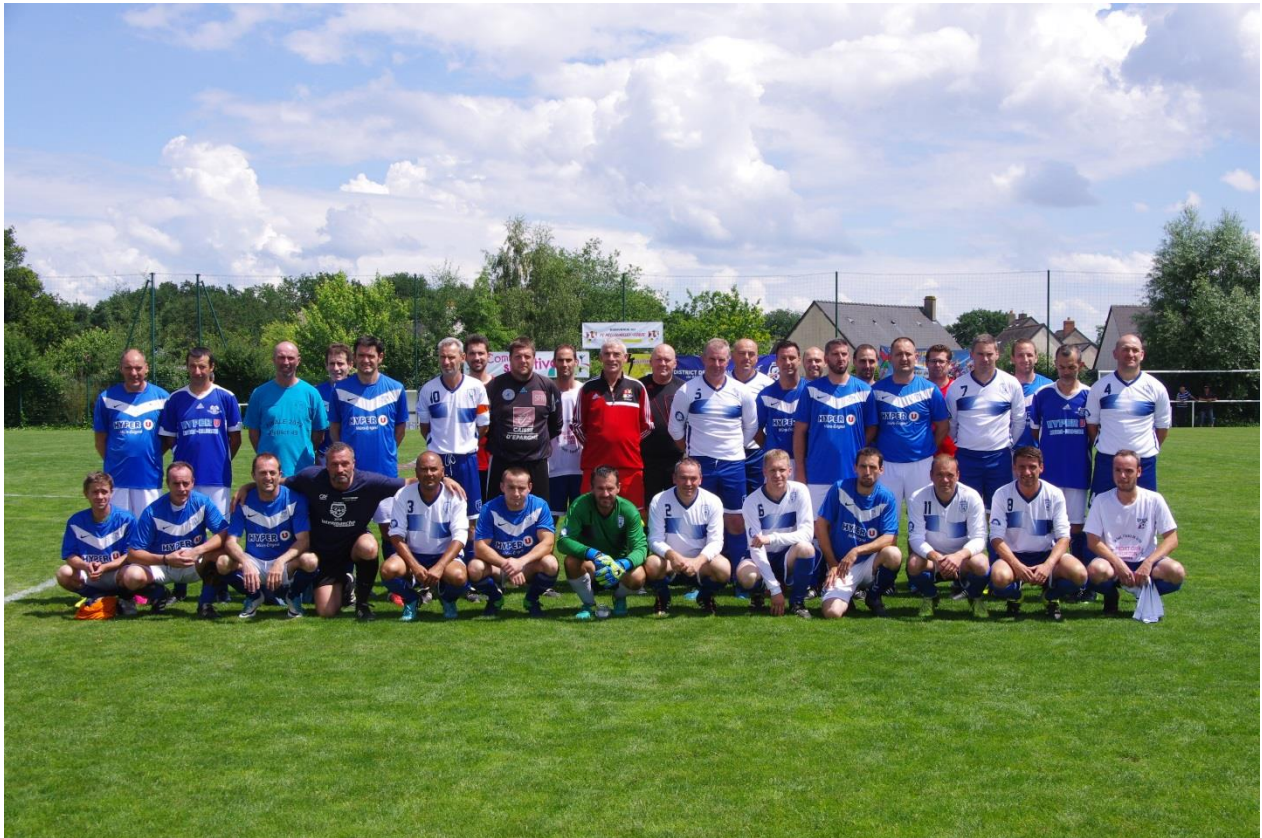
St Melaine/Aubance - E/La Pommeraye Pomj Équipes finalistes de la Coupe de l'Amitié Vétérans – Juin 2018