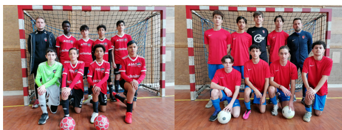
Demi-finales Challenge de l'Anjou U15/U17 Futsal 🗨️