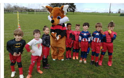
Carnaval des p'tits footeux 🗨️