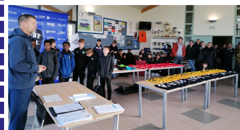
Détection U13 🗨️

Les dispositions du présent alinéa s'appliquent également dans les compétitions de leur catégorie d'âge aux joueurs ayant disputé les championnats des jeunes.