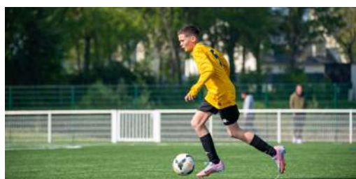
Détection U13 - 18.04.2023