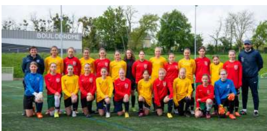
Centre de Perf U14F - 25.04.2023