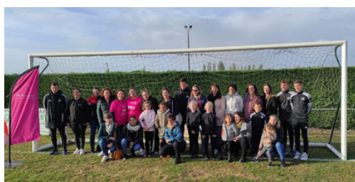
Octobre Rose - Actions clubs 🖱️

Objectif : Soutenir une bonne cause et sensibiliser nos licenciés sur un sujet important !