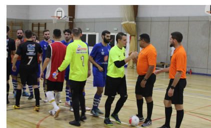
Lancement du championnat Futsal 🖱️