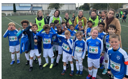
Coaching des mamans 🖱️