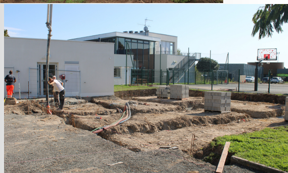
LUNDI 2 OCTOBRE