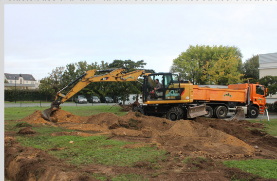
JEUDI 28 SEPTEMBRE

Je tiens à remercier particulièrement le groupe de travail pour tout le travail effectué depuis quelques mois. Vous pourrez retrouver, chaque mois, l'évolution des travaux via notre site internet ou notre Newsletter !