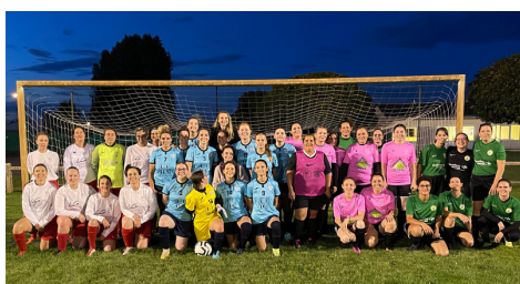
Lancement du Foot Loisir Seniors F 🙋