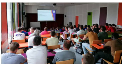
Réunion de rentrée U11 U13 U15F 🙋

Objectif : Se déplacer en limitant l'émission de gaz à effet de serre !