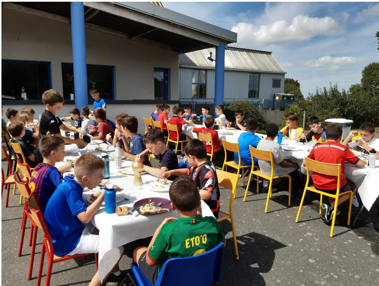
Repas équilibré imposé