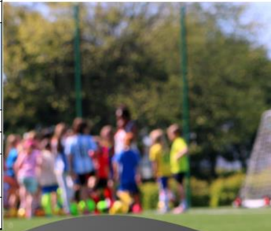
Programme jour 3