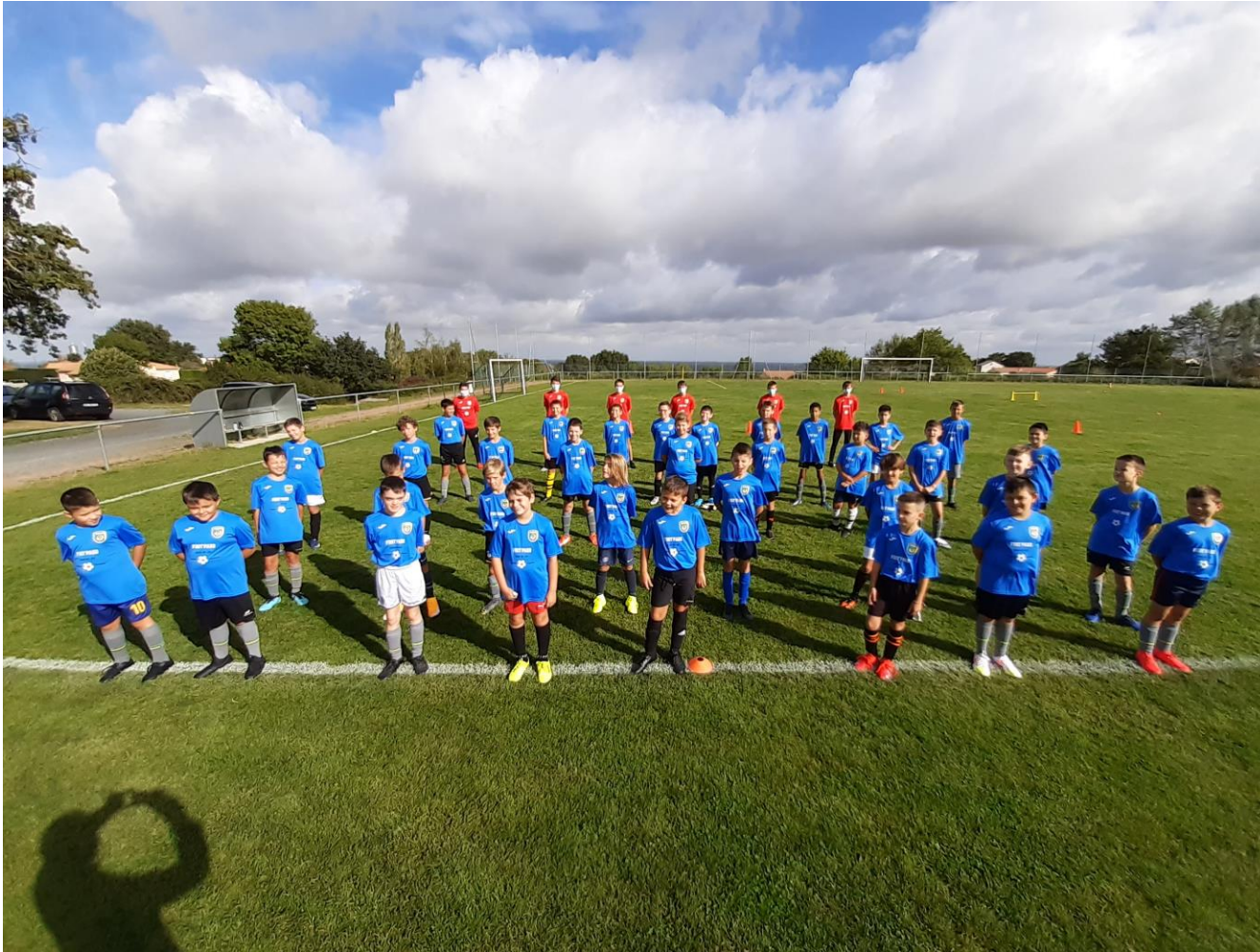
encadrants en rouge